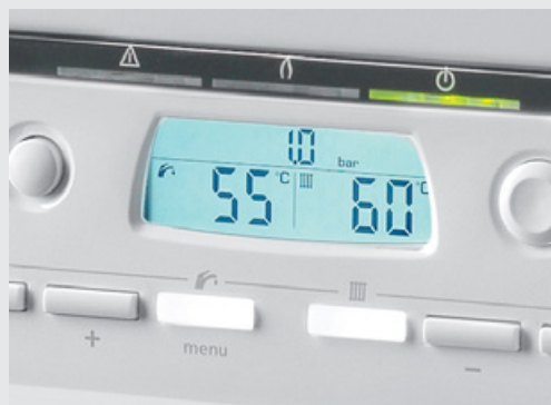
Přehledný ovládací panel pro snadnou obsluhu s velkým podsvíceným displejem