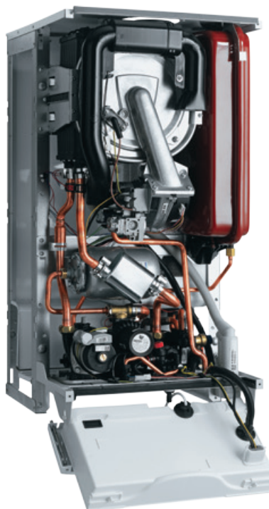
Nová konstrukce kondenzačního kotle s vestavěným zásobníkem Protherm Tiger Condens

Využijte širokou nabídku originálního příslušenství značky Protherm.